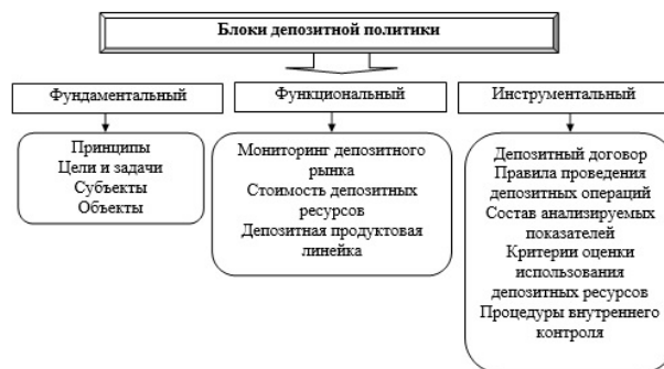
Рис. 1. Элементы политики коммерческого банка по привлечению временно свободных денежных средств.