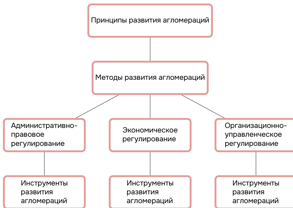
Рис. 2. Механизм развития агломераций как территориальных социально-экономических систем (составлено авторами).