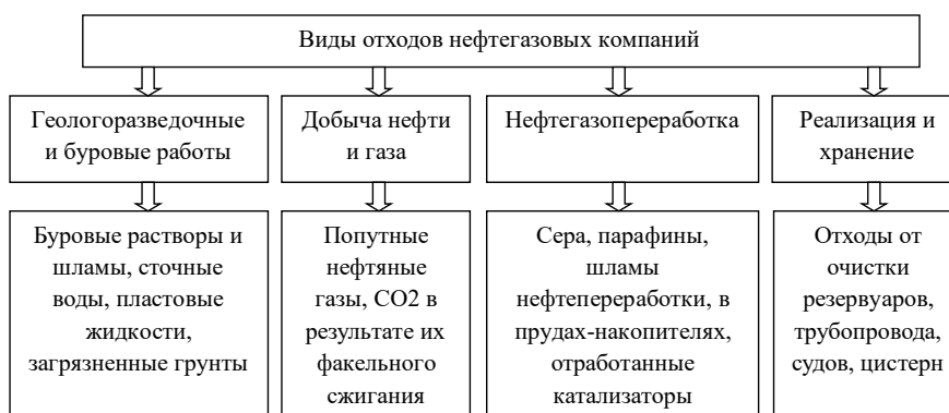
Рис. 2. Виды отходов нефтегазовых компаний по этапам производственно-коммерческого цикла.

предварительную оценку методов управления отходами, создавать 3D-модели перемещения отходов в рамках производственно-коммерческого цикла, тем самым принимать более обоснованные решения.