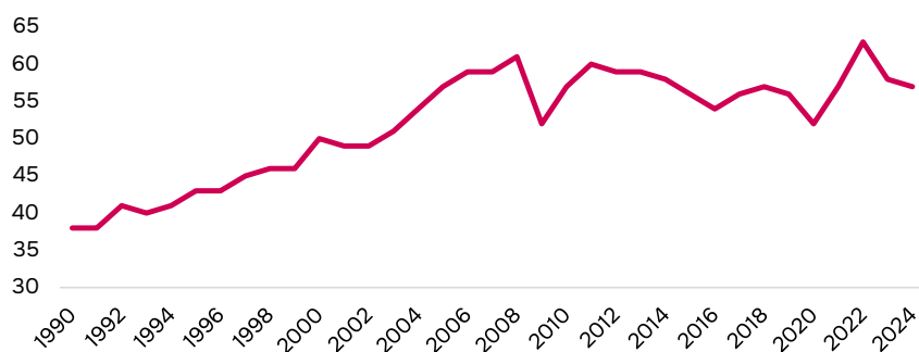
Рис. 1. Доля мировой торговли в мировом ВВП, % (1990–2024) [36].