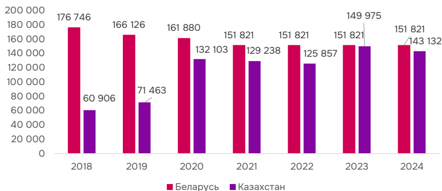
Рис. 2. Динамика производства тканей в Беларуси и Казахстане в 2018–2024 гг., тыс. м 2

объединении. Падение в 2021 году связано с последствиями кризисных процессов 2020 года из-за воздействия коронавирусной пандемии, что привело к разрывам логистических цепочек. Кроме этого, произошёл рост цен на сырьё, а также идентифицировалась конкуренция с зарубежными импортными товарами, в том числе из Китая и Турции, которые используют и нетрадиционные инструменты для обеспечения усиления своего рыночного положения, в том числе с помощью использования такого инструмента, как маркетплейсы (Рисунок 3).