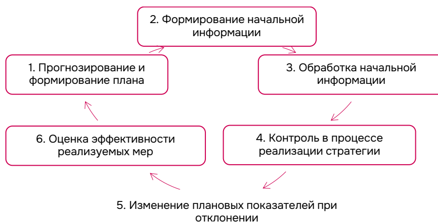
Рис. 2. Типовой алгоритм работы с информацией в рамках планирования развития экономики и социальной жизни региона в стратегической перспективе.