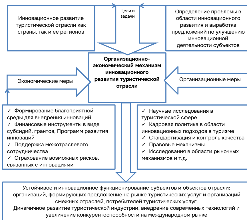
Рис. 3. Организационно-экономический механизм обеспечения инновационного развития туристической отрасли.