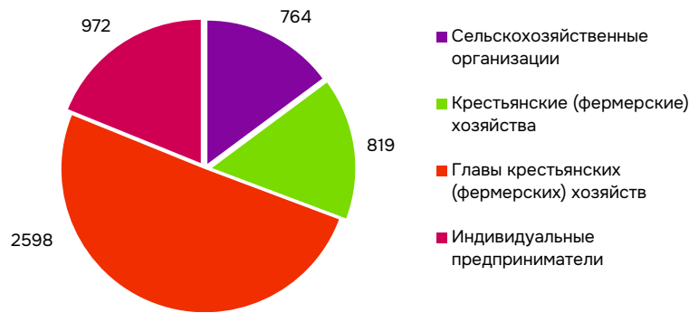
Рис. 1. Количество субъектов сельскохозяйственного производства Оренбургской области по категориям хозяйств на 01 января 2023 года, ед.