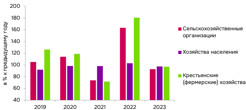
Рис. 2. Индексы производства продукции сельского хозяйства по категориям хозяйств, в % к предыдущему году.

по всем категориям хозяйств происходило периодическое снижение индексов (с последующим ростом) по причине неурожая и сложившейся ценовой политики на продукцию, но следует отметить, что ежегодно лидирующее положение в производстве сельскохозяйственной продукции Оренбургской области занимают КФХ.