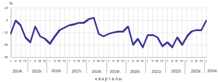
Рис. 1. Индекс ожидаемых изменений экономической ситуации [11].