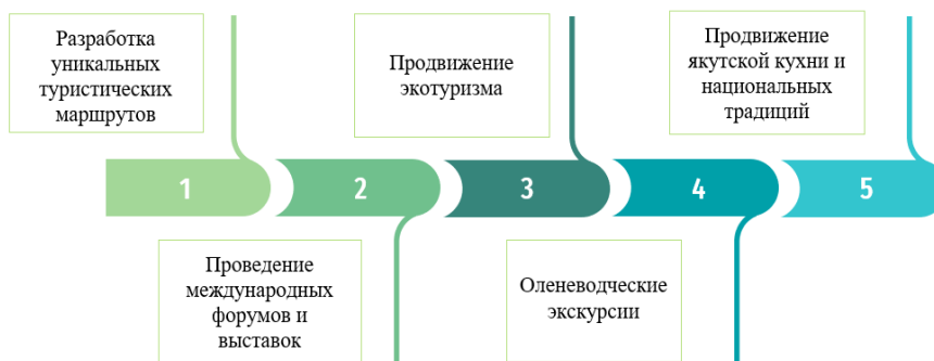
Рис. 1. Основные направления развития туризма в Республике Саха (Якутия). Разработано автором.

расположенное на глубине 10–12 метров, где температура воздуха круглогодично держится на уровне от минус 5 до плюс 7 °С. Это связано с нахождением слоя вечной мерзлоты, не позволяющего теплу проникать внутрь. Следующей точкой маршрута является поездка в Ленский природный заповедник, расположенный на территории в 4 млн га и являющийся местом обитания редких видов растений и животных. Завершающим пунктом данного маршрута выступает посещение сокровищницы Якутска. Посещение этого музея позволяет увидеть туристам драгоценные экспонаты и узнать больше о добыче и производстве драгоценных камней и металлов в этом регионе.