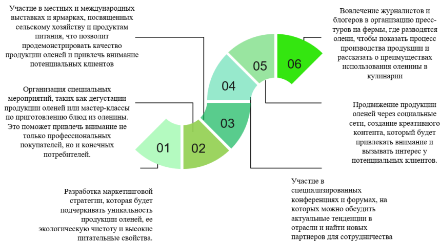
Рис. 3. Комплекс мероприятий, направленный на продвижение продукции оленеводства на рынок. Разработано автором.

и разрешений, обучение персонала и проведение маркетинговых мероприятий.