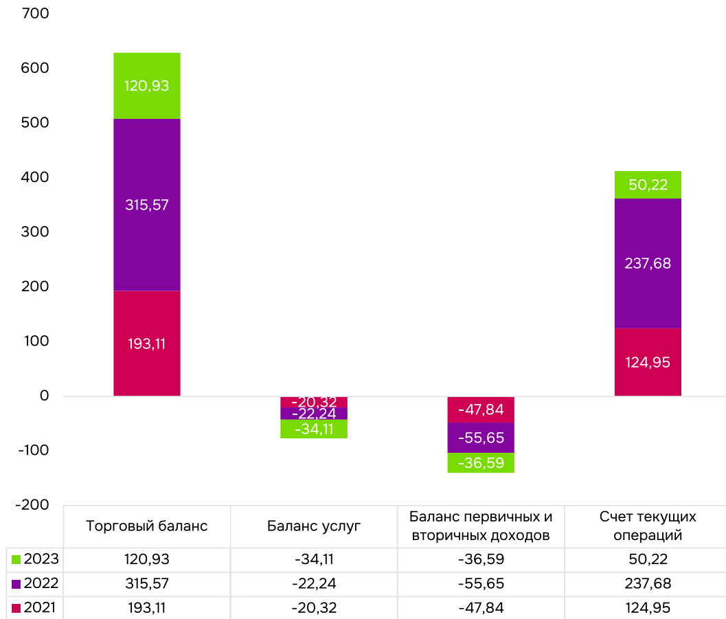
Рис. 3. Соотношение основных компонентов счета текущих операций в 2021–2023 годах, млрд долларов США (составлено авторами по материалам [6]).