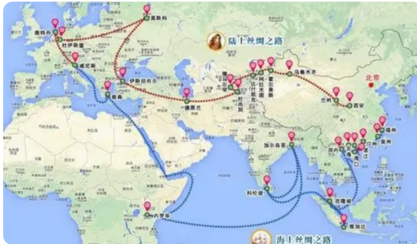
Рис. 2. «Шелковый путь» и «Морской шелковый путь». Источник: https://www.zaoxu.com/jjsh/bkdq/407547.html .

сектора экономики. Зоны открытости в виде различных модификаций особых экономических зон расширяются от прибрежных районов до внутренних районов страны. Данные меры приводят к тому, что к 2000 году совокупный объем фактически использованных иностранных инвестиций достиг 370 миллиардов долларов США [3]. Режим использования иностранных инвестиций меняется в сторону особого контроля качества и эффективности. Иностранные инвестиции способствуют росту потребления в Китае продуктов питания и одежды, происходит быстрый рост китайской легкой промышленности. Таким образом, на данном этапе происходит дальнейшее активное развитие концепции «ввоза», а также начинает формироваться концепция «выхода вовне» в связи с формированием китайских национальных преимуществ в участии в международном экономическом сотрудничестве и конкуренции.