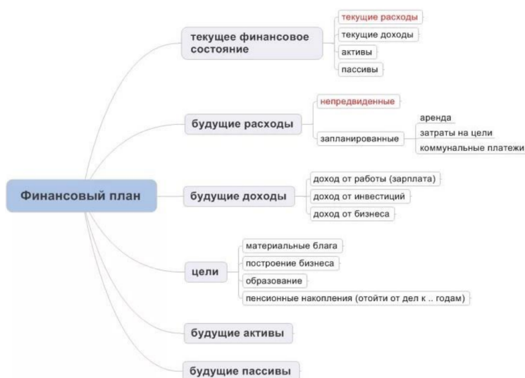
Рис. 2. Примерная структура вашего финансового плана.