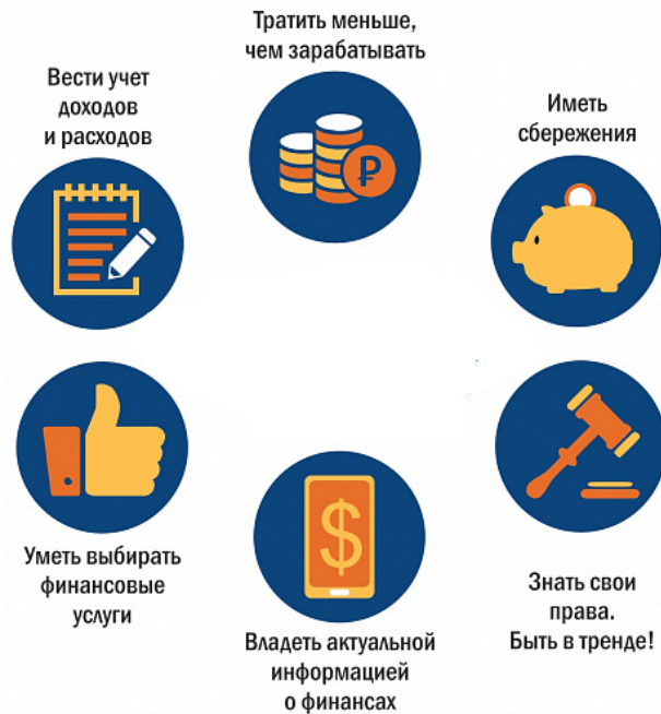
Рис. 1. Что такое финансовая грамотность.

зуют кредитные, заемные правоотношения, поэтому повышение финансовой грамотности в этом направлении лишним явно не будет; то же самое касается инвестиций, налоговой системы и т.д. [4].