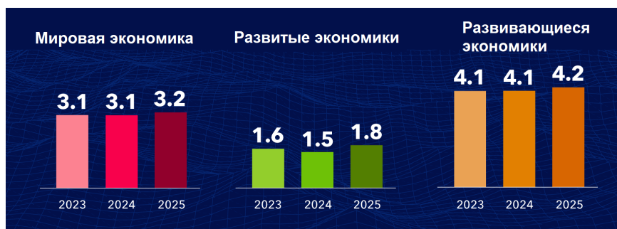
Рис. 2. Прогнозы перспектив мировой экономики [30].

переезда в Россию, которая, несмотря на санкционное давление, продолжает испытывать экономический рост вопреки всем отрицательным прогнозам международных организаций в 2022 году [31]. Традиционные ценности, особая защита семьи и детей, гарантированное государством здравоохранение и курс на превентивную медицину – все эти аспекты являются выгодными точками контраста между российскими реалиями и жизнью в большинстве стран, куда уехали наши соотечественники за последние десятилетия. Эффективными и резонансными могут быть и дополнительные «лотереи» (по