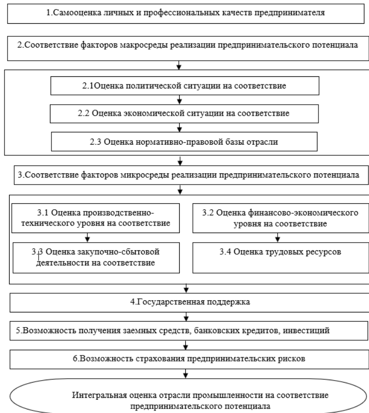
Рис. 2. Теоретико-методический подход к оценке отрасли промышленности в контексте реализации предпринимательского потенциала.

понятие «предпринимательство», неразрывно связано с личностью предпринимателя. В данном контексте имеется ввиду не только предпринимателя с юридической точки зрения, но и потенциального предпринимателя. Самооценка профессиональных качеств относится к сфере организации и технологии производства, пониманию производственных процессов, бизнес-процессов в целом, экономического и технического образования. Производственное предпринимательство требует специфической научной организации труда, серьезного подхода к материально-техническому оснащению ресурсному потенциалу. Все эти вопросы предприниматель должен поставить себе и сам же на них ответить.