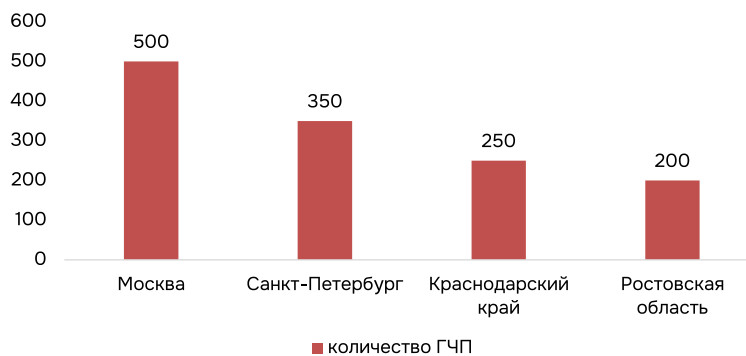
Рис. 2. Наиболее участвующие в программах ГЧП территории (составлено автором на основе статистики).

или заемных средств, обращение к ГВ может позволить реализовать определенные инновационные программы и привлечь частные инвестиции. Это позволит развивать разные секторы национального хозяйства и положительно влиять на привлекательность территорий, что особенно важно в условиях кризиса [1, с. 563].