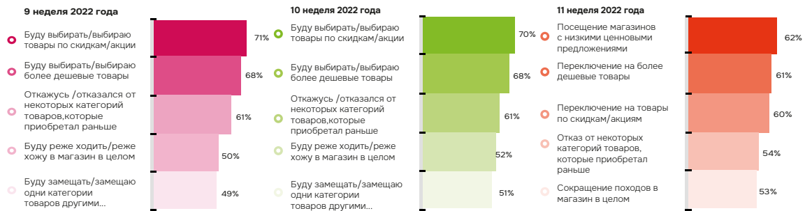
Рис. 1. ТОП-5 стратегий оптимизации трат на товары первой необходимости:

Скажите пожалуйста, какие действия вы предпринимаете или собираетесь предпринять, чтобы преодолеть эти экономические трудности?