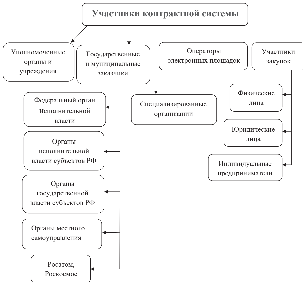
Рис. 2. Участники контрактной системы в сфере закупок РФ

ключенный от имени муниципального образования для обеспечения муниципальных нужд;