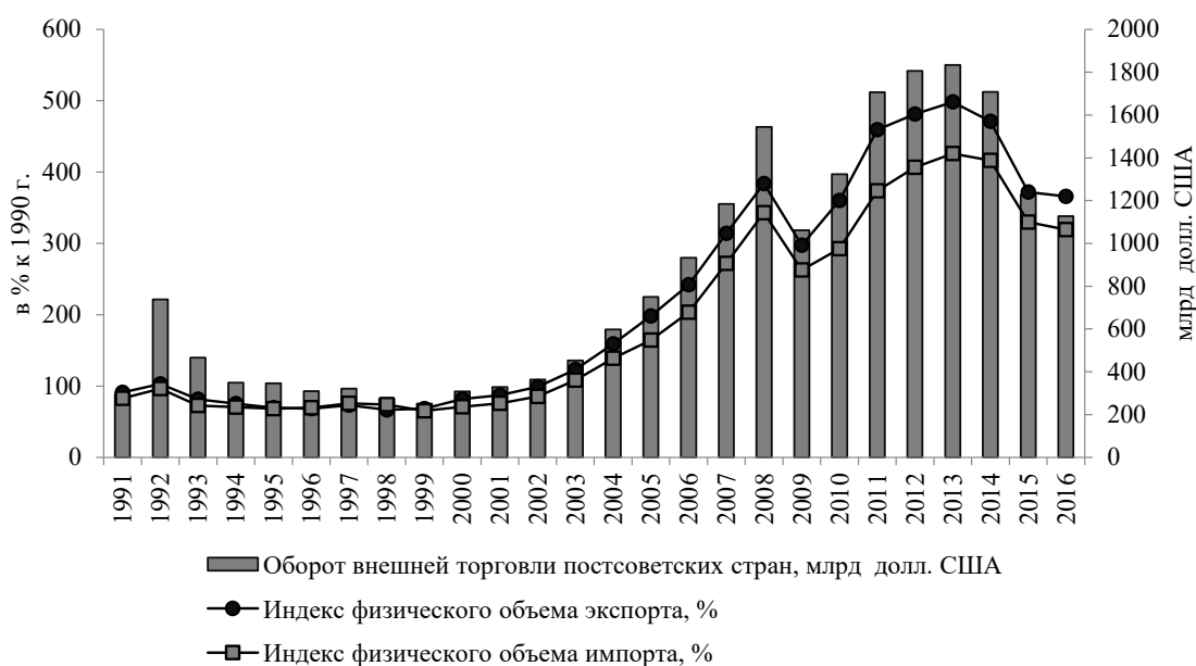
Рис. 2. Динамика экспорта-импорта постсоветских стран