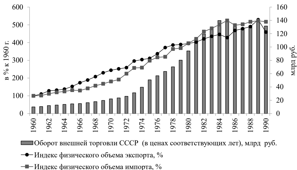
Рис. 1. Динамика экспорта-импорта СССР

мых и вывозимых товаров разная (таблица 1).