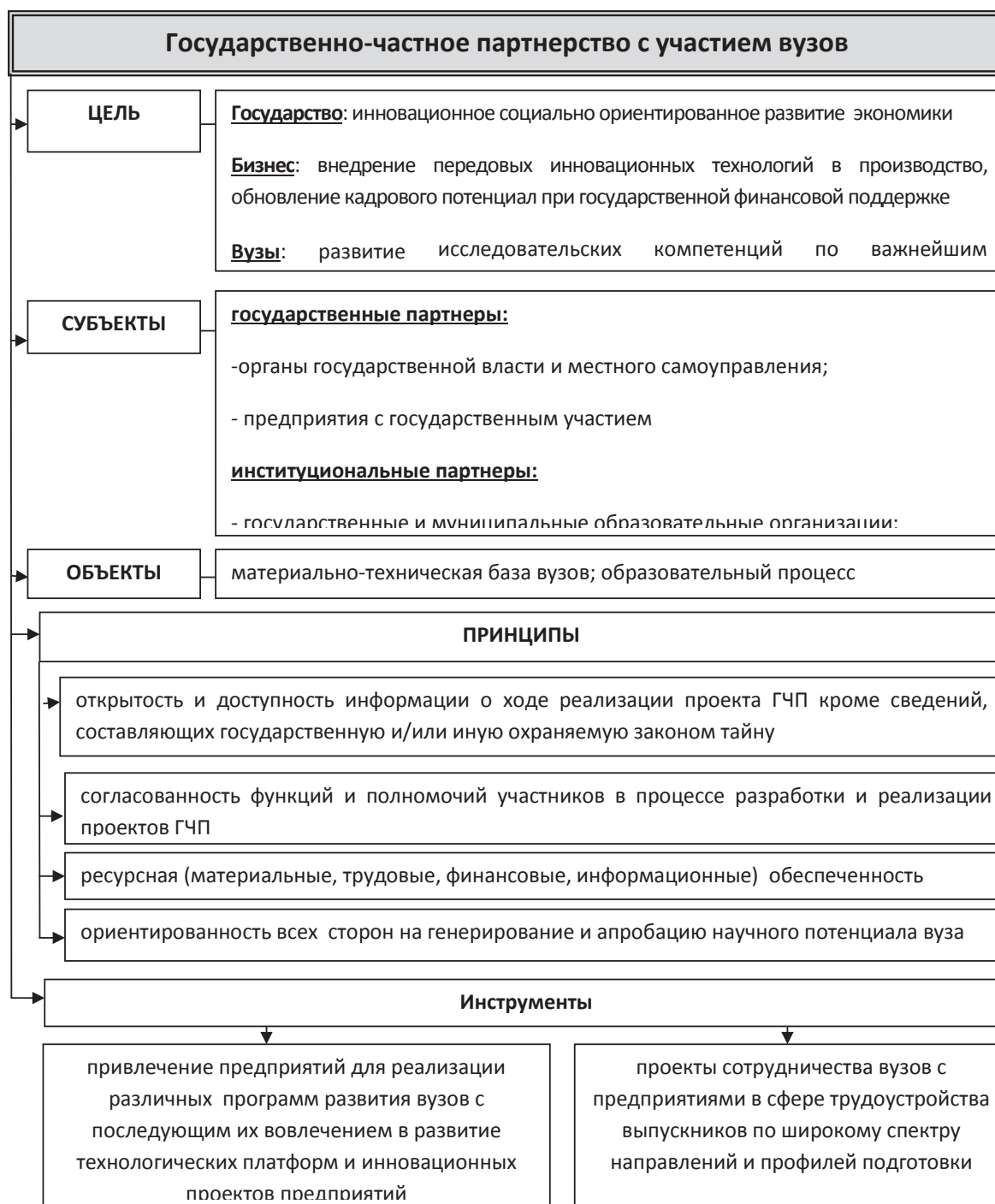
Рис. 3. Авторская модель государственно-частного партнерства с участием высших учебных заведений

тия высших учебных заведений, представляется возможным сформулировать стратегические ориентиры их развития: интеграция функций обучения, научных исследований и предпринимательства; стимулирование инновационных научных исследований и разработок за счет создания профильных технологических платформ с предприятиями высокотехнологичного секто-