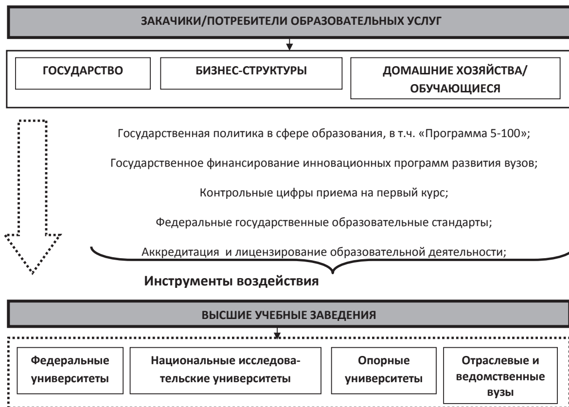
Рис. 1 Взаимодействие заказчиков/потребителей образовательных услуг и вузов

Анализ данных, представленных в табл. 1,