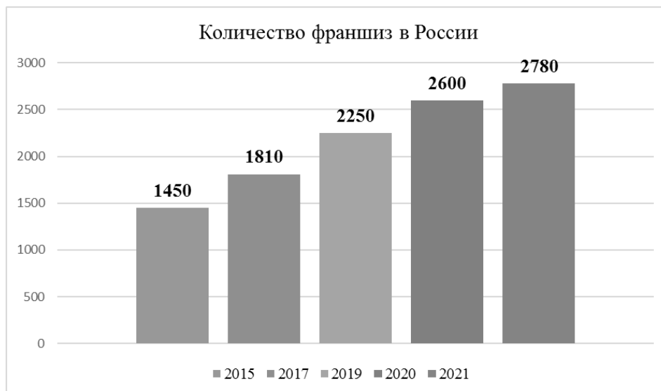
Рис. 1. Число зарегистрированных франшиз в России в динамике за 2015–2021 год. [1]

Москвы весной 2020 года утвердило программу субсидий для франчайзи в размере 1 млн. руб. Участником программы могли стать предприятия малого и среднего бизнеса, которые зарегистрированы не менее чем за полгода до подачи заявки и в качестве налогоплательщика на территории Москвы.