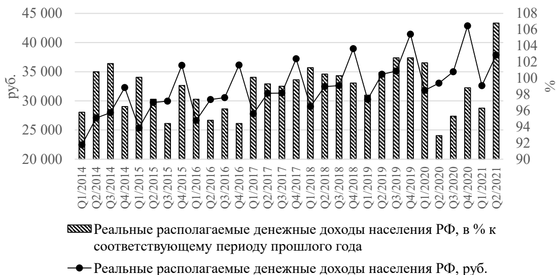
Рис. 3. Динамика денежных доходов населения России за период 2014–2021 годы

ющий тренд уровня безработицы, что обусловлено окончательным формированием рыночных механизмов в стране, но при этом кризисы (мировые и внутристрановые) дают толчок для роста рассматриваемого индикатора, это объясняется шоковыми воздействиями на реальный сектор экономики и как следствие высвобождение и переопределение рабочей силы между отраслями и секторами. Также стоит отметить, что для возврата уровня безработицы на глобальный тренд, экономической системе необходимо от 1 года до 3 лет., т.е. с каждым последующим периодом своего развития система становится более устойчивее.