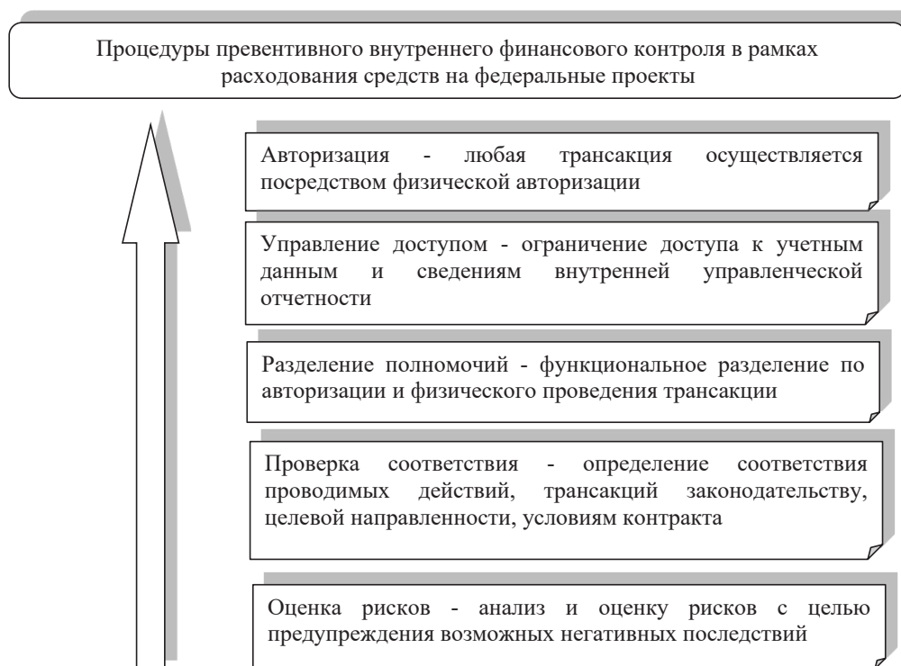
Рис. 3. Процедуры превентивного внутреннего финансового контроля в рамках расходования средств на федеральные проекты