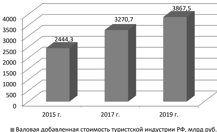
Рис. 1. Динамика валовой добавленной стоимости, создаваемой туристской индустрией РФ за период 2015–2019 г, млрд руб. (в сопоставимых ценах)

рекреационной инфраструктуры Сочи в связи с проведением XXII Олимпийских игр, а также Чемпионата мира по футболу 2018 г.; повышением разнообразия и улучшением качества производимых в РФ туристско-рекреационных продуктов. Указанные факторы способствовали повышению вклада туризма в валовой внутренний продукт РФ с 3,3% в 2015 г. до 3,9% в 2019 г. (+0,6%). Графическая интерпретация данного процесса представлена на рисунке 2 [7].