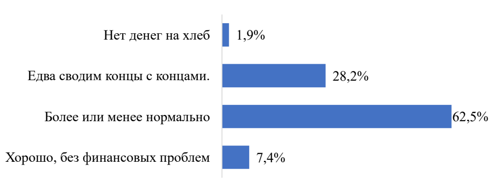
Рис. 3. Оценки мигрантами финансового положения своих домохозяйств