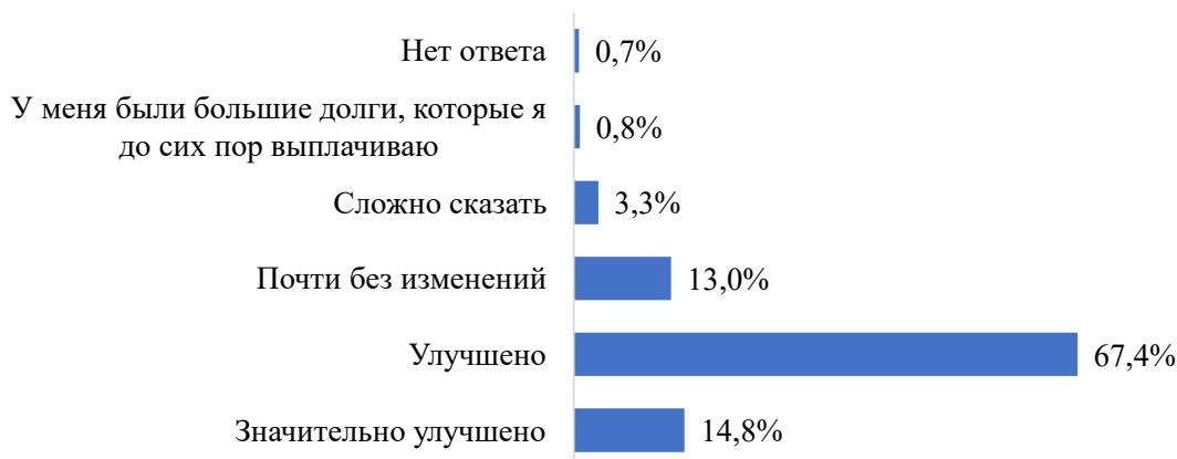
Рис. 2. Как изменилось финансовое положение семей трудовых мигрантов

Но в остальном структура доходов для этих двух групп резко различается. Если семьи со