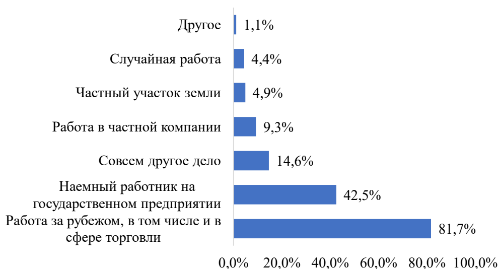
Рис. 4. Основные источники дохода домохозяйств мигрантов

средним уровнем дохода в основном получают 15% доходов от продажи личных вещей и 10% — от продажи сельскохозяйственной продукции, то домохозяйства мигрантов получают 0,3% и 4,9% соответственно (от частных хозяйств).