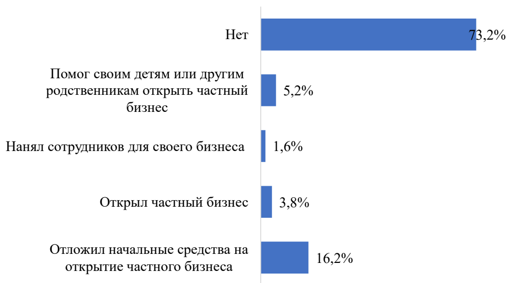
Рис. 6. Влияние миграции на открытие мигрантами бизнеса