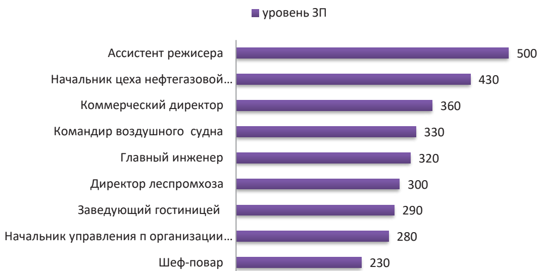
Рис. 1. Уровень заработной платы в различных отраслях и сферах деятельности [5]