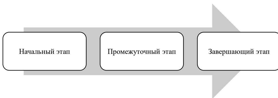
Рисунок 2. Основные этапы получения государственной поддержки для предпринимателя