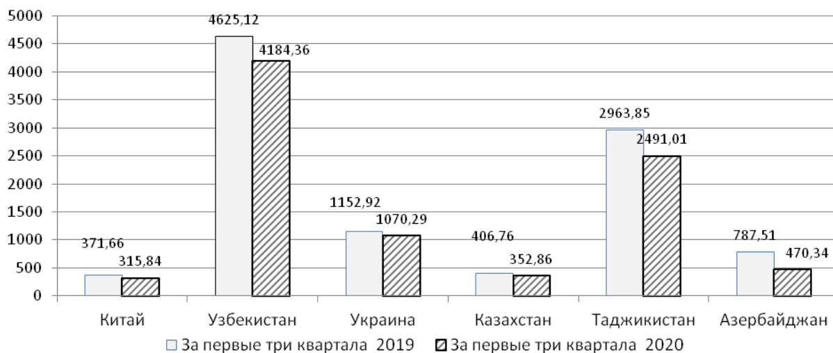
Рис. 2. Основные потоки прибывших трудовых мигрантов