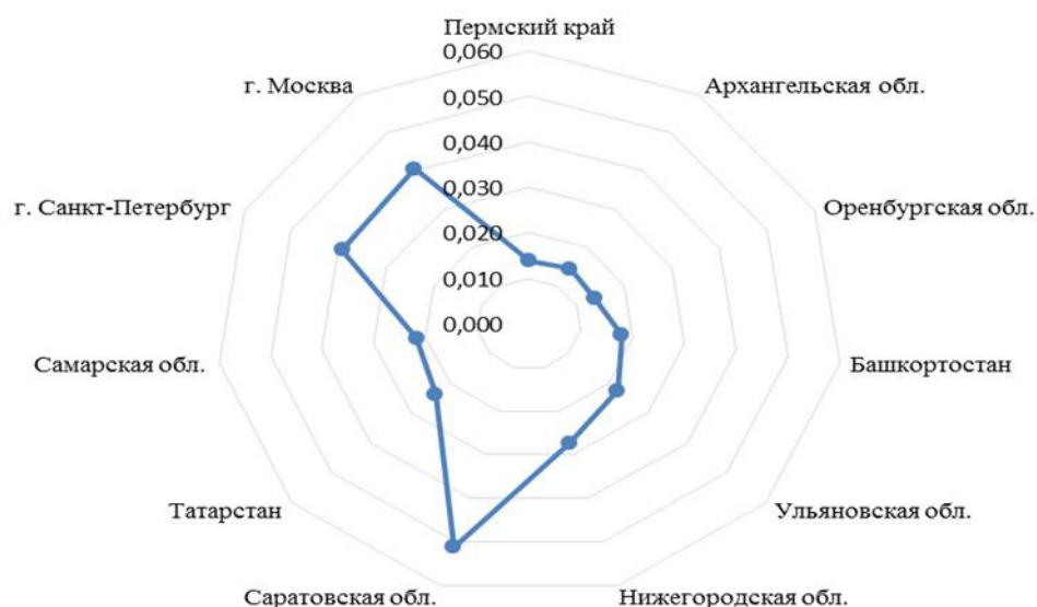
Рис. 2. Распределение внедрения инноваций и интеллектуального капитала в регионах РФ.

На основе проведенного исследования нами сделан вывод о том, что сущность нематериального капитала проявляется в непрерывности самовоспроизводства и активизации материального производства, балансировке материального и нематериального, основного и переменного капиталов в социально-экономической системе (задействованный в производстве экономический ресурс, приносящий доход, рента превышающую экономические издержки на его использование, и способный активизировать производственный процесс в невещественной