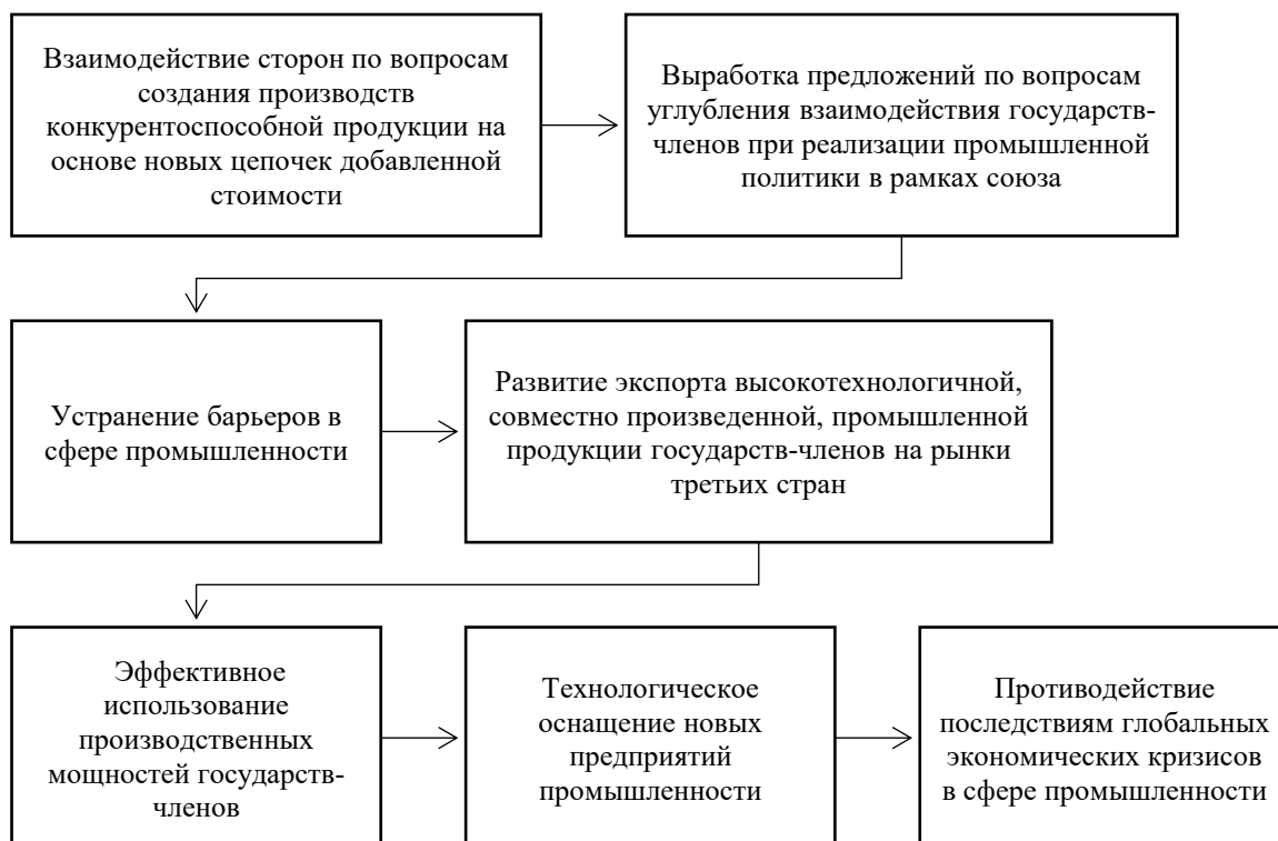
Рисунок 3. Функции совета по промышленной политике ЕАЭС