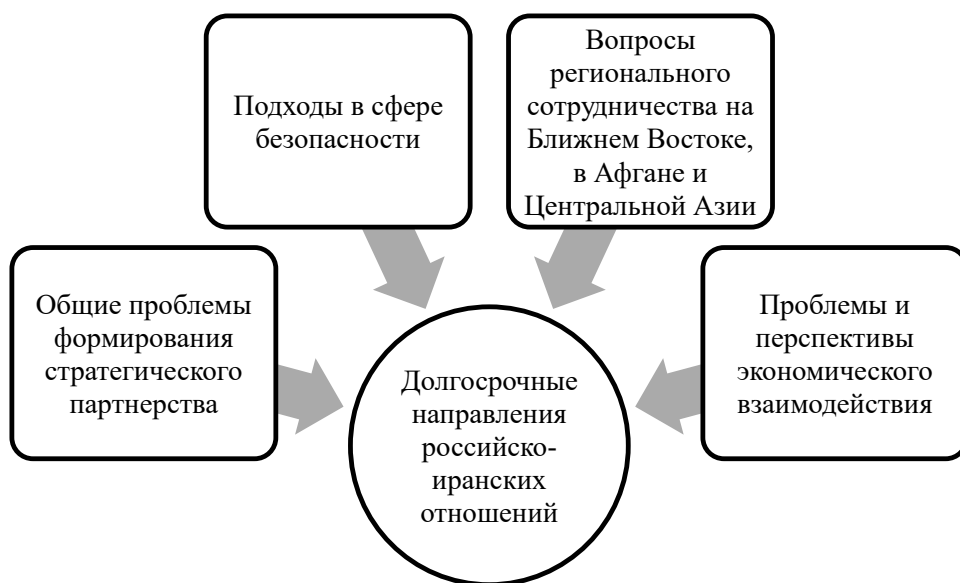
Рисунок 2. Направления многостороннего российско-иранского партнерства