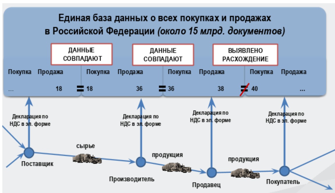
Рисунок 2. Схема расширенного декларирования НДС.