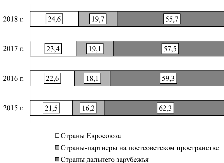
Рисунок 2. Структура импорта продовольственных товаров и сельскохозяйственного сырья, %

в динамике сократился 6,6%. Евросоюз на фоне санкций не только не уменьшил собственную долю в импорте продовольственных товаров и сельскохозяйственного сырья России, но даже нарастил, что на фоне роста объема абсолютного показателя свидетельствует о низкой эффективности российского эмбарго в адрес европейских стран. Рост доли стран-партнеров на постсоветском пространстве в импорте России говорит об углублении внешнеторговых связей с ними, что происходит за счет усиления роли Беларуси.