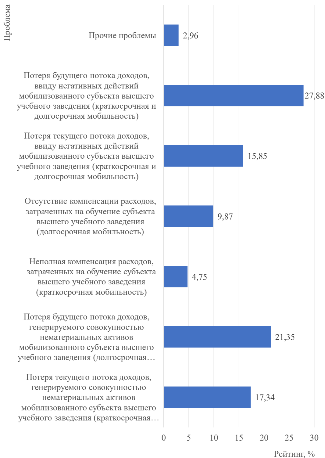
Рис. 3. Сводный рейтинг выявленных проблем взаимосвязи академической мобильности и экономической безопасности в высших учебных заведениях Российской Федерации по состоянию на 01.01.2020 года