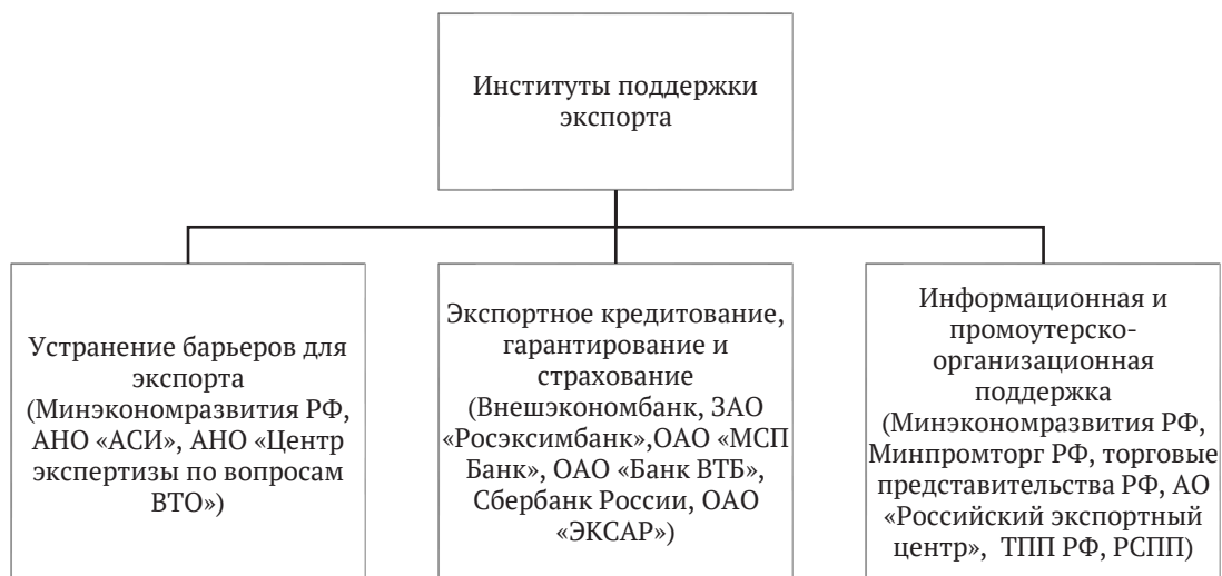
Рисунок 4. Основные институты поддержки экспорта в Российской Федерации и их функции

Система институтов поддержки экспорта в России. В отличие от ведущих стран-экспортеров, система государственной поддержки экспорта в Российской Федерации не столь развита, поскольку формируется на протяжении незначительного периода времени, в основном, в течение последних 25 лет. В настоящее время в Российской Федерации действуют институты поддержки экспорта товаров и услуг, составляющие разветвленную систему (рисунок 4).