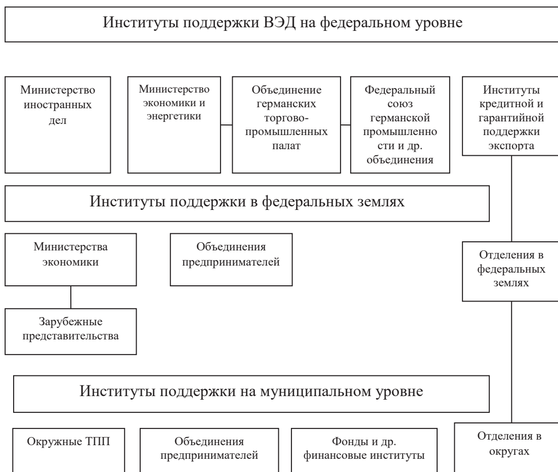
Рисунок 2. Основные институты национальной системы поддержки экспорта Германии [1]

чия и ответственность разделены между двумя ключевыми министерствами: Министерством иностранных дел и Министерством предпринимательства, инноваций и профессионального образования (рисунок 3).