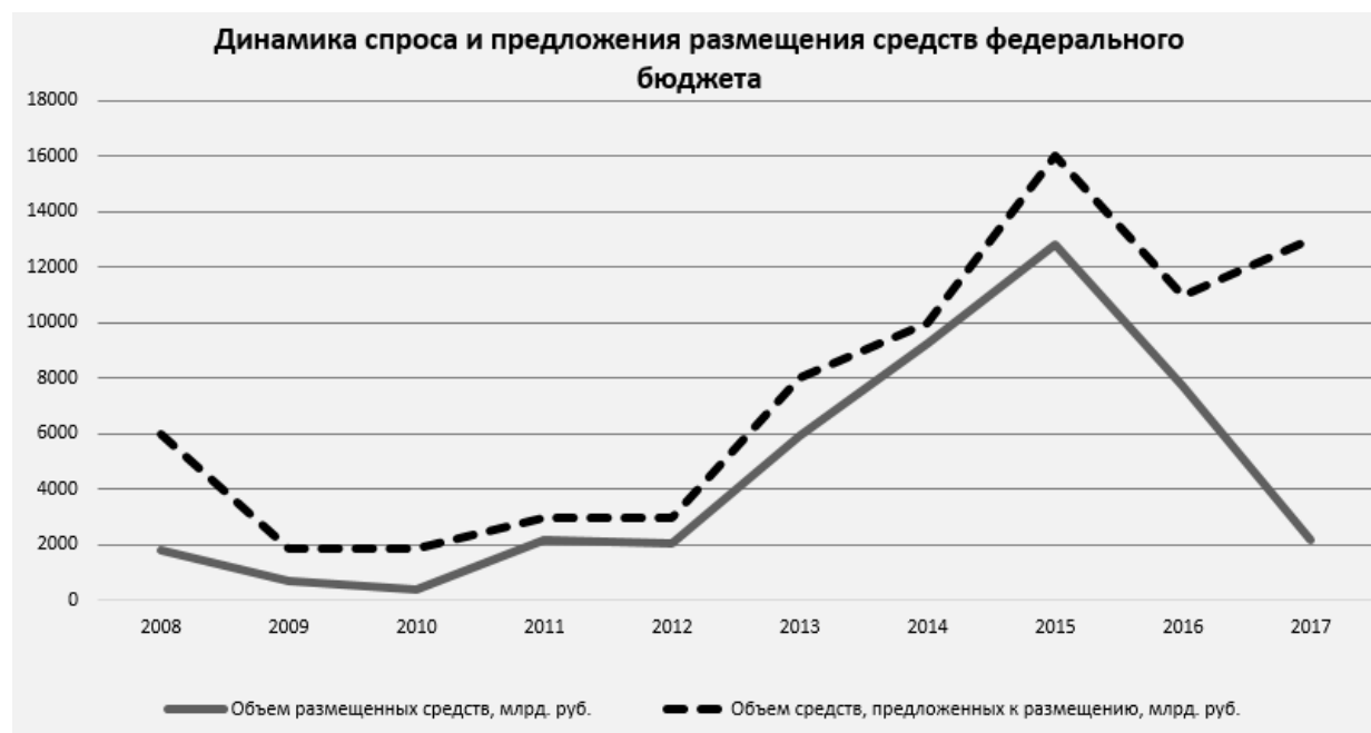
Рис. 1. Динамика спроса и предложения размещения средств федерального бюджета 2008–2017 года [3]

Вместе с тем, наличие широкой линейки инструментов активного управления ликвидностью позволило Казначейству России применить