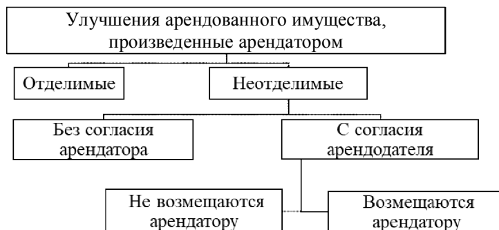
Рис. Виды улучшений арендованного имущества

Если арендатор производит отдельные улучшения в виде установки оборудования, требую-