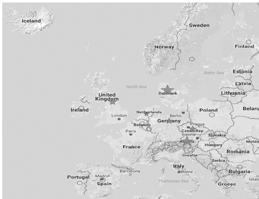
Рис. 3. Картирование биотехнологических кластеров Европы по методологии Европейской кластерной обсерватории

На сегодняшний день Европейской кластерной обсерваторией выделено свыше 2000 региональных кластеров, из них три “звезды” имеют 155 кластеров (8 %), две “звезды” - 524 кластера (25 %), одну “звезду” - 1338 кластеров (67 %) 9 .