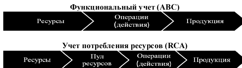
Рис. 2. Различие методов учета