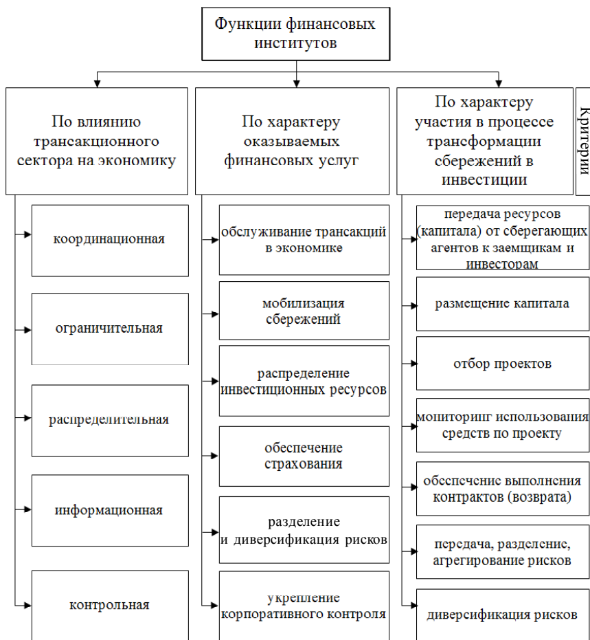
Рис. 1. Классификация функций финансовых институтов в экономике