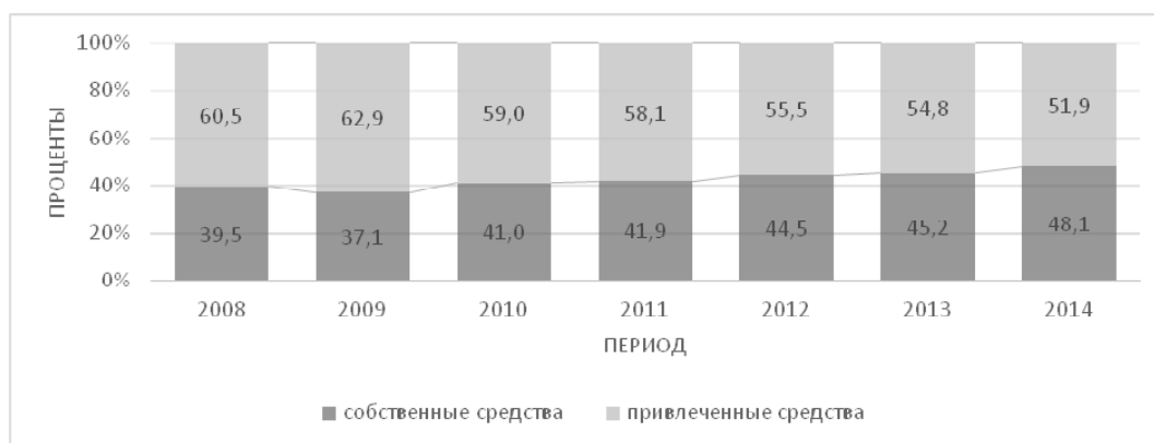
Рис. 3. Изменение структуры инвестиций в основной капитал в РФ по источникам финансирования в 2008-2014 гг., %

С 2009 г. наглядно отмечается увеличение уровня самообеспеченности в РФ: в 2009 г. удельный вес инвестиций в основной капитал посредством собственных средств составлял 37,1 %, причиной чему явилось сложное финансовое состояние предприятий в тот период, а уже в 2014 г. он принял значение 48,1 % (против 51,9 % посредством привлеченных средств), что, безусловно, можно оценить как положительную тенденцию (см. рис. 3).