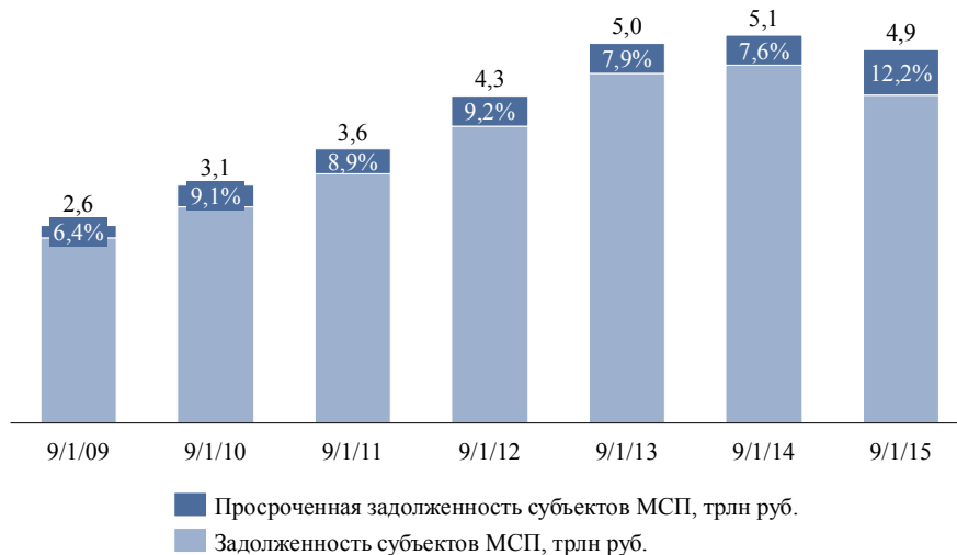
Рис. 2. Динамика задолженности МСП (2009-2015 гг.)