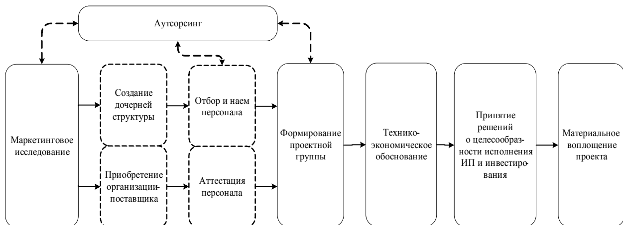
Рис. 1. Этапы жизненного цикла инновационного проекта

Этап 2. Создание дочерней структуры и(или) приобретение организации поставщика (в том случае, если речь идет о корпоративных структурах). На данном этапе в большей степени будут присутствовать инвестиционные затраты, связанные с капитальными вложениями по приобретению или содержанию дочернего предприя-