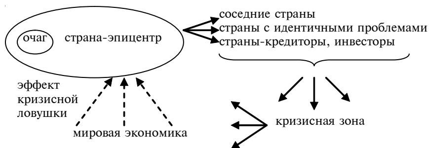
Рис. 1. Механизм формирования мирового экономического кризиса. Эффект кризисной ловушки

Причины кризиса могут возникать и действовать в долговременном периоде, постепенно