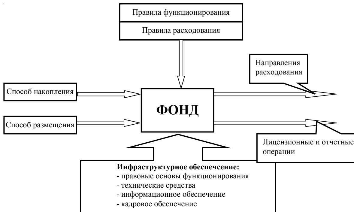
Рис. 2. Образование фондов денежных средств

ко он успешно решает поставленную перед ним задачу, являясь элементом финансов предприятия. Создание фонда немыслимо вне рамок финансов предприятия.