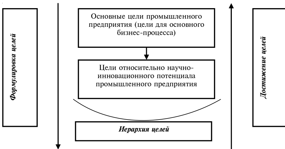
Рис. 2. Соотношение основных целей и целей относительно научно-инновационного потенциала промышленного предприятия

• обеспечение соответствия основных стратегических целей предприятия и целей управления его научно-инновационным потенциалом;