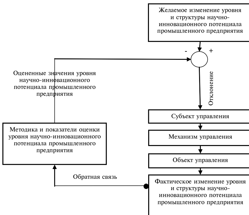
Рис. 5. Функционирование системы управления научно-инновационным потенциалом промышленного предприятия: кибернетическое представление

Таким образом, процесс управления научно-инновационным потенциалом промышленного предприятия является итерационно-динамическим, на каждом его шаге оцениваются последствия реализации принятых решений, от эффективности которых зависят не только уровень и структура научно-инновационного потенциала, но и сопряженное с ним качество функ-