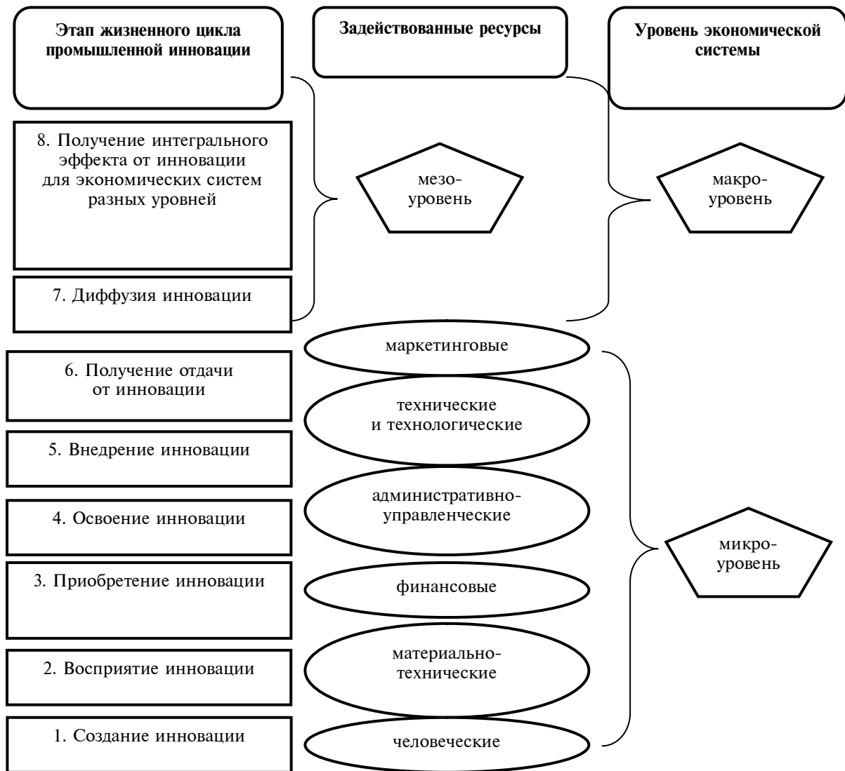
Рис. 1. Вовлечение отдельных видов экономических ресурсов на разных этапах жизненного цикла промышленной инновации

тальные только и исключительно дополняют их; отсутствие необходимых и имеющих соответствующее качество человеческих ресурсов продуцирует невозможность создания инноваций, поскольку научно-инновационный потенциал промышленности рассматривается как совокупность возможностей отрасли к созданию, внедрению, освоению, диффузии инноваций с получением эффекта для системы каждого уровня (предприятия, региона, страны). Но “возможность” как таковая не позволяет структурировать научно-инновационный потенциал. Как правило, его структурируют по составляющим, что представляется закономерным и в данном случае, но с добавлением необходимых уточнений и дополнений.