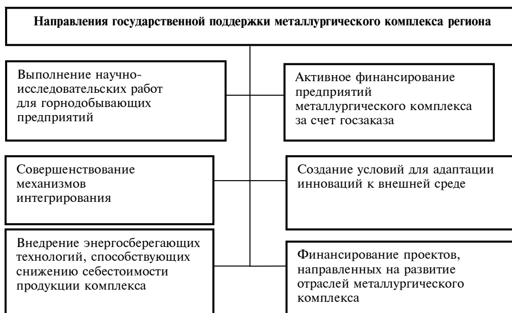
Рис. 2. Направления государственной поддержки металлургического комплекса Свердловской области

ставления рыночной экономики и потенциальным возможностям развития региона. Так, в крупном бизнесе не происходит заметного роста наукоемких видов экономической деятельности, не получают должного развития инновационные формы бизнеса, что является необходимым условием эффективного функционирования 2 .