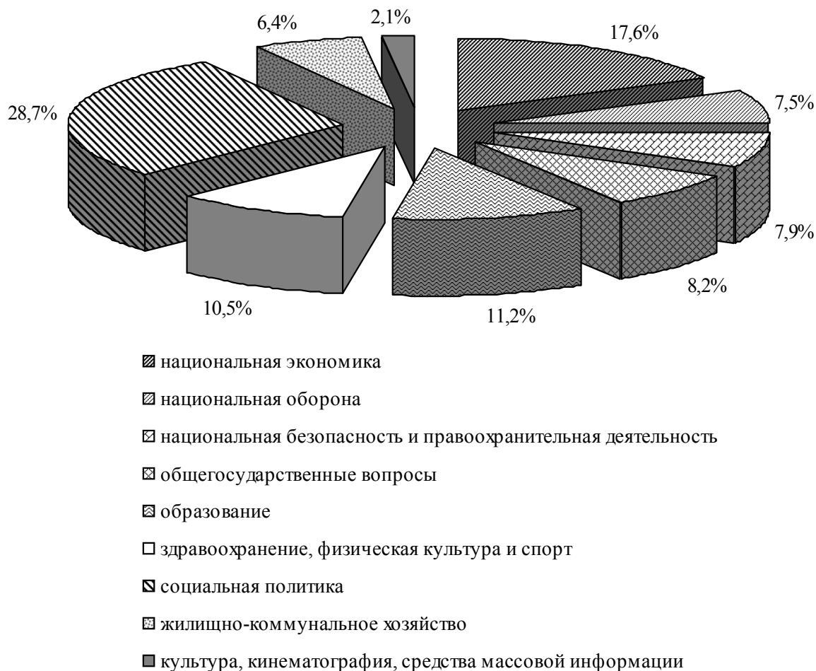
Рис. 2. Структура расходов консолидированного бюджета Российской Федерации в 2010 г. (диаграмма рассчитана и построена автором на основе данных информационно-аналитического раздела сайта Министерства финансов Российской Федерации ( http://info.minfin.ru/ ))

ляющих привлечь “длинные” деньги в отрасль, целью которых будет кардинальная модернизация и перестройка всей системы. При этом особое внимание следует уделить вопросам управления системой предоставления услуг жилищно-коммунального хозяйства с учетом сложившихся социально-экономических противоречий.