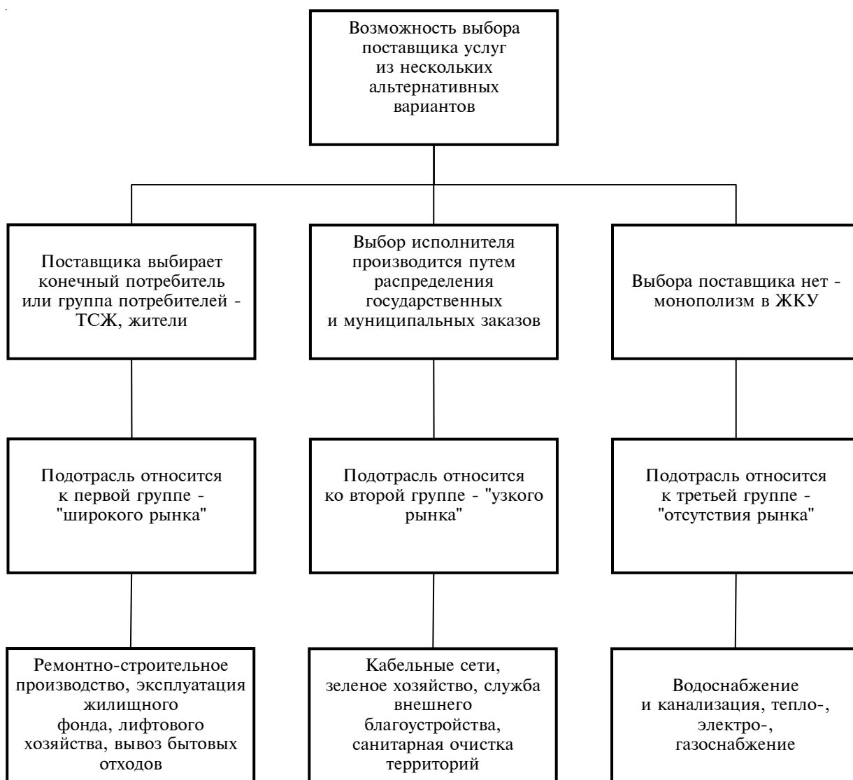
Рис. 3. Предлагаемая схема разделения подотраслей жилищной сферы на группы по наличию в них конкурентной среды с целью дифференцированного подхода к применению методов исследования рынка

более 3100 различных вариантов развития ситуаций в ЖС. Для этого, в соответствии с разработанной автором теоретической структурой модели АСУ-ЖХС, по данным Администрации Санкт-Петербурга, была создана база данных (БД) об инвестиционно-коммунальной среде в городе. В качестве компьютерной техники автором была применена система Cabletron Systems (рис. 3).