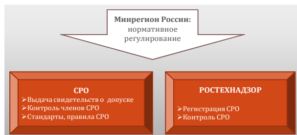
Рис. 2. Изменения в регулировании рынка (с 1 января 2009 г.)

Государственная политика в отношении развития строительного комплекса может быть эффективной только при условии, если она совпадает с идеологией и мотивами самих субъектов либо наоборот. Важную роль в системе идеологических институтов играют нормы и правила административной и деловой этики, формирование принципов доверительного отношения и добросовестного соблюдения правил (рис. 2).