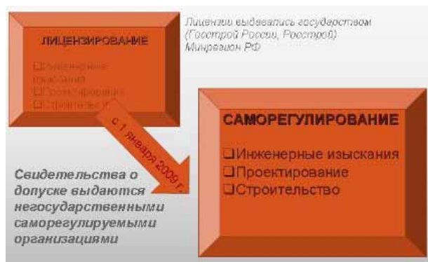
Рис. 1. Изменения в системе допуска на рынок

Формирование и поддержание успешной деятельности строительной организации в современных условиях рыночной экономики напрямую зависит от эффективности управления организацией, которое должно обеспечивать поддержание, развитие потенциала организации, его трансформацию в конкурентные преимущества. Представим изменение процедуры допуска на рынок строительных организаций (рис. 1).