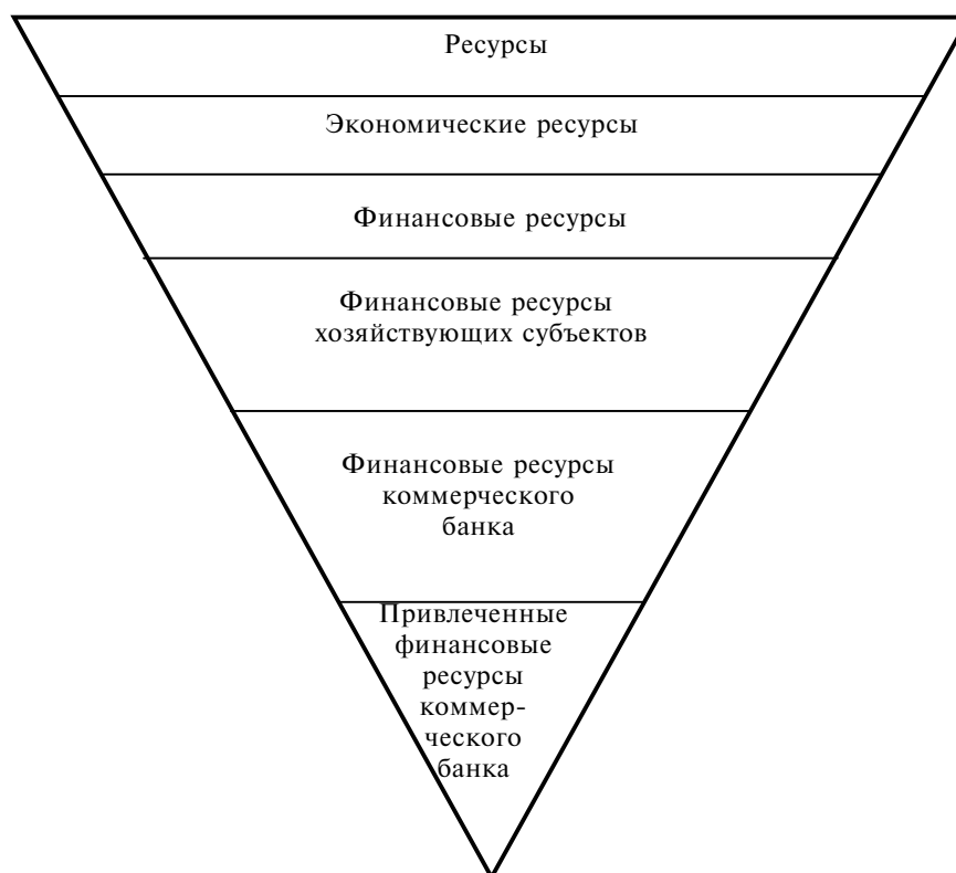
Рис. 1. Иерархия ресурсов общества

• как капитал банка (собственные средства) и обязательства (привлеченные средства и заемные средства) 3 ;